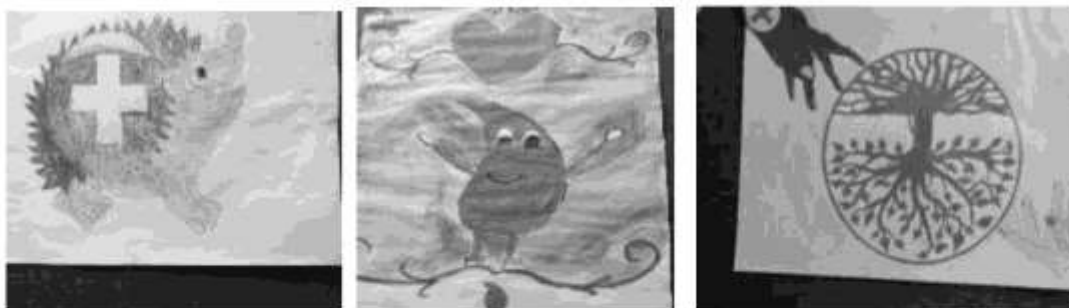
На конкурс су учествовале 3 основне школе са око 50 ликовних радова.

Ради омасовљења давалаштва крви, у сарадњи са основним школама, реализован је и конкурс „Крв живот значи“, а најбољи радови су послати су ЦКС ради учешћа на такмичењу на вишем нивоу.