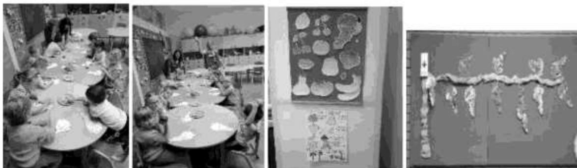
Предавање о здравој исхрани, зашто је воће важно, таблои у школи