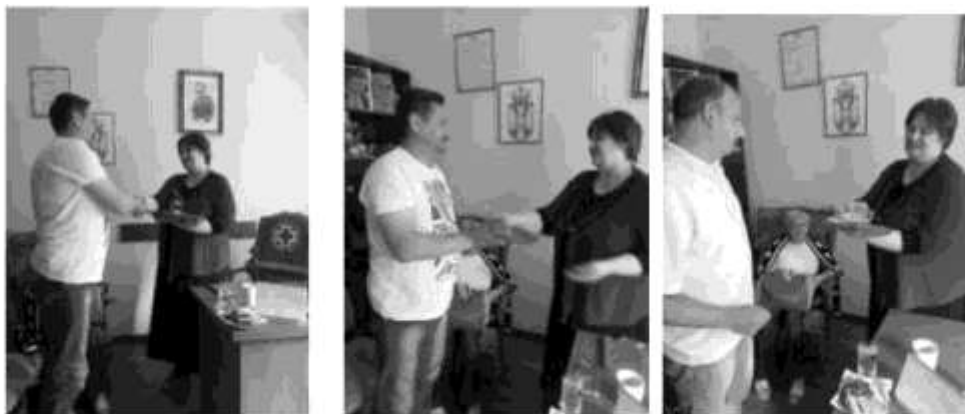
14. Јун –Међународни Дан даваоца крви

Ради омасовљења давалаштва крви, у сарадњи са основним школама, реализован је и конкурс „Крв живот значи“, а најбољи радови су послати су ЦКС ради учешћа на такмичењу на вишем нивоу.