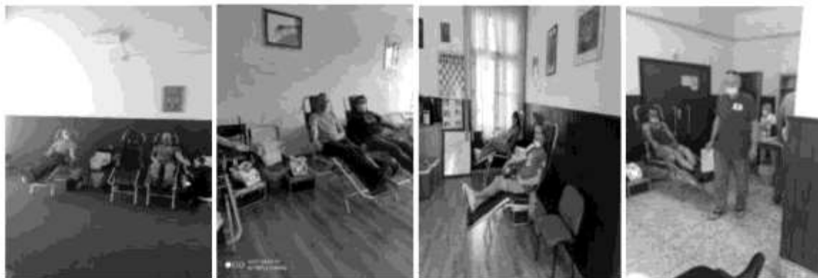
Добровољни даваоци крви на акцији

Едукован и уигран тим волонтера ради на реализацији ове активности. Тај тим је у ранијим годинама и подмлађен, тако да имамо довољан број волонтера који могу квалитетно организовати акције.