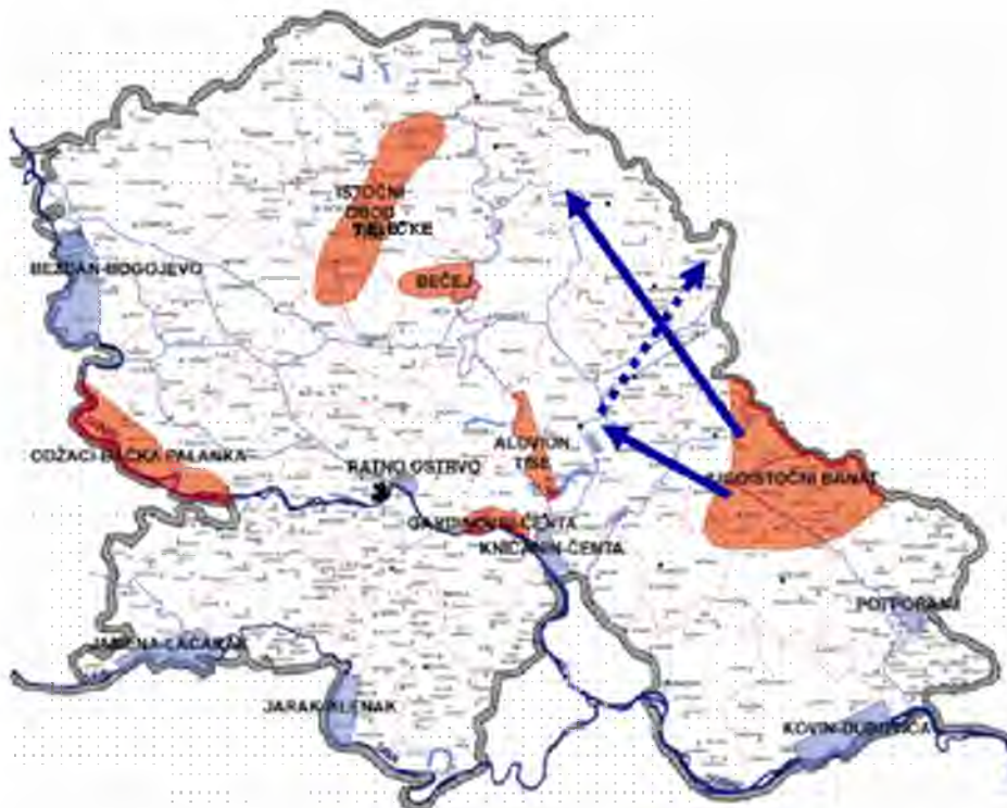
Слика II-2. Микорегионална изворишта – могући правци водоснабдевања (Стратегија водоснабдевања општина Житиште, Нова Црња и Сечањ, ПМФ – Департман за хемију, биохемију и заштиту животне средине, Нови Сад)

одакле би се даље дистрибутивним цевоводима слала ка потрошачима – свим насељима у општини Нова Црња.