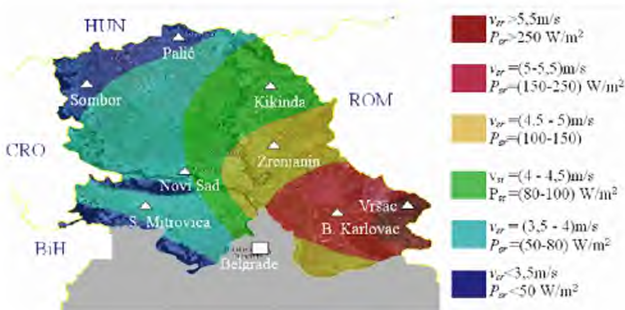
Слика II -1. - Приказ брзине и енергетског потенцијала ветра на висини 50m у W/m 2 W

Постојање каналске мреже на овом простору пружа могућност коришћења хидроенергије за производне енергетске објекте мањих капацитета (10MW).